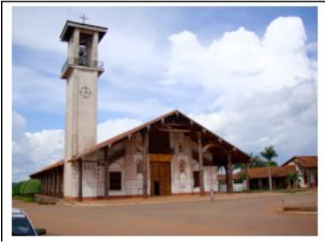
Eglise de San Ignacio

Temps libre pour visite de la ville, marche central artisanal.