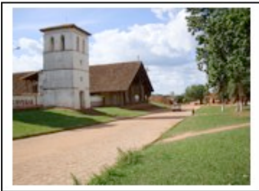
Eglise de San Miguel

16h : Départ pour la mission de Santa Ana, dernière Mission de Chiquitos fondée juste après l'expulsion des jésuites selon le même modèle.