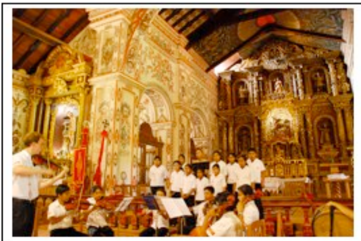
L'école de musique locale dans le superbe cœur de l'église de Concepcion

Retour a l hôtel pour repos, dîner et concert a l église de Concepcion.