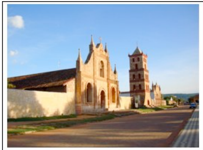
Eglise de San Jose de Chiquitos

Nuflo de Chavez a joint par deux fois l'océan Atlantique au Pacifique (Lima) et fut nommé la deuxième fois gouverneur de Moxos et Santa Cruz par le Vice Roi d'Espagne, installé à Lima.