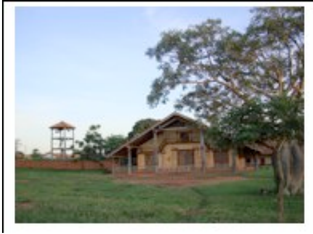
Eglise de Santa Ana

Visite de la Mission et de l'église et des différents ateliers d'artisanat. Ballade éco touristique sur un lieu sacré : le Viboron, pierre basaltique du pré cambrien et lieux de croyance des Chiquitos. Dîner et concert à l'église de Santa Ana avec son orgue du 18ème siècle. Retour à San Ignacio à l'hôtel.