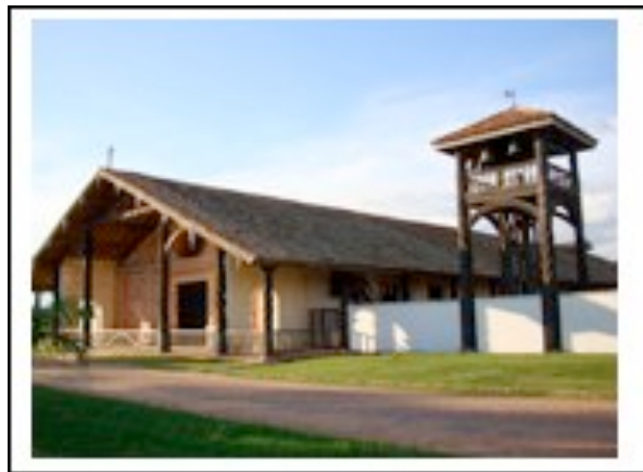
Eglise de San Rafael