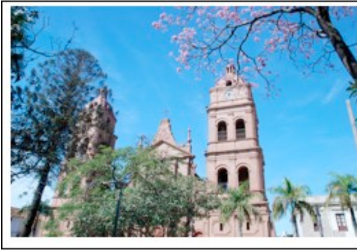
Cathédrale San Lorenzo

15h-18 : Visite du centre écologique Gembe-Mariposario a 10km de la ville, volière a papillons, perroquets, aras, toucans, orchidées, île au singe, lagunes et piscines.