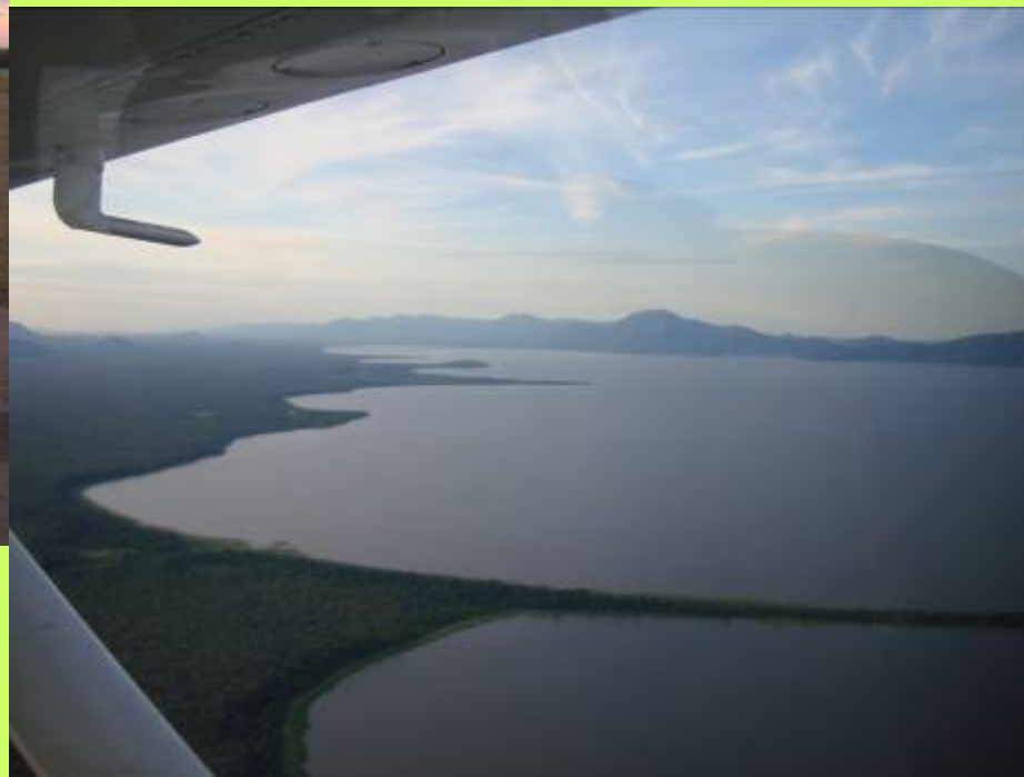
Embarquement pour une vue du ciel