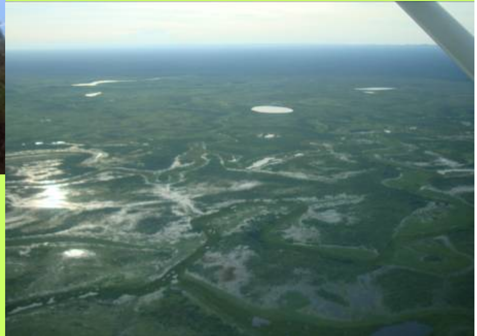
Le Pantanal vue d'avion