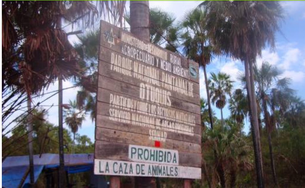
L'entrée du parc Otuquis