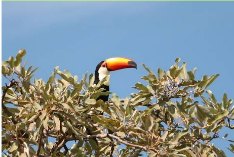
Sa majesté le Toucan

La piste rejoignant Puerto Bush traverse le parc