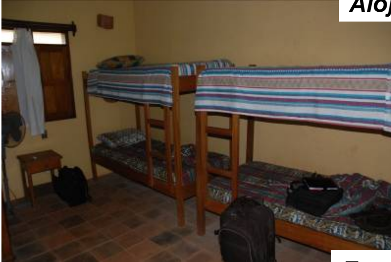
Alojamiento de Santa Ana