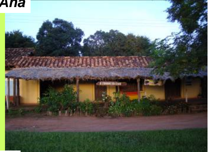
Eco albergue de Chochis