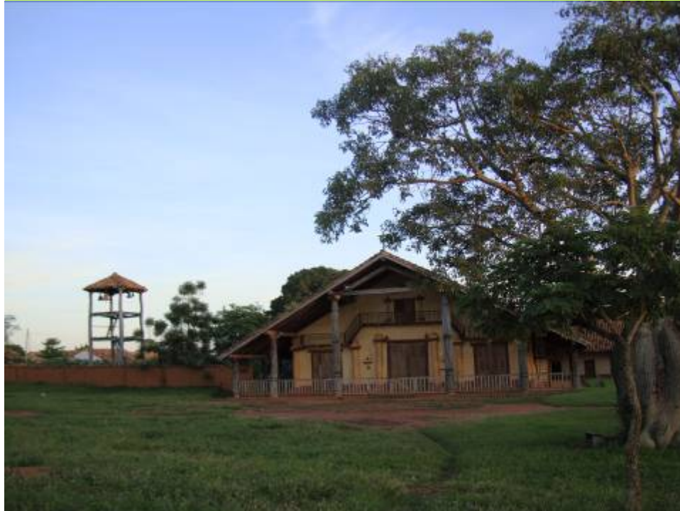
La Iglesia de Santa Ana