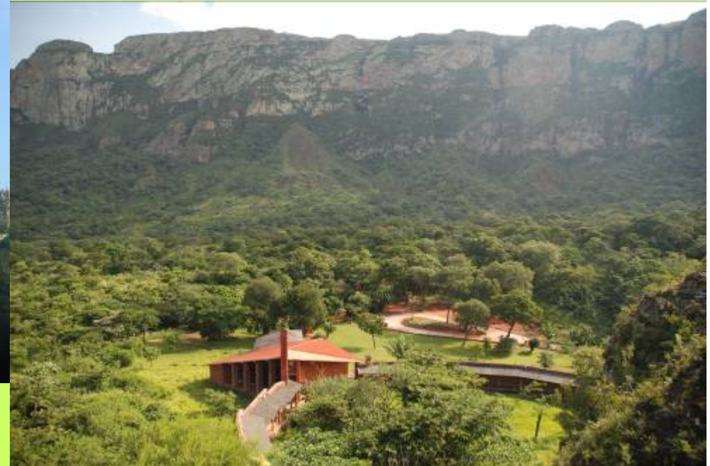
El santuario y el portón