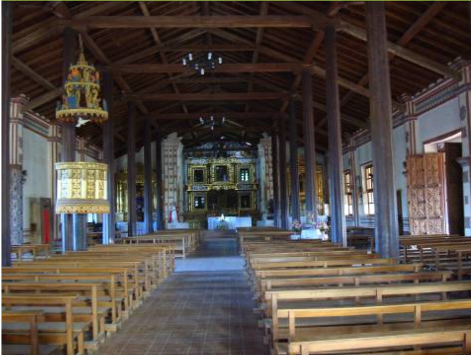
La Iglesia de San José