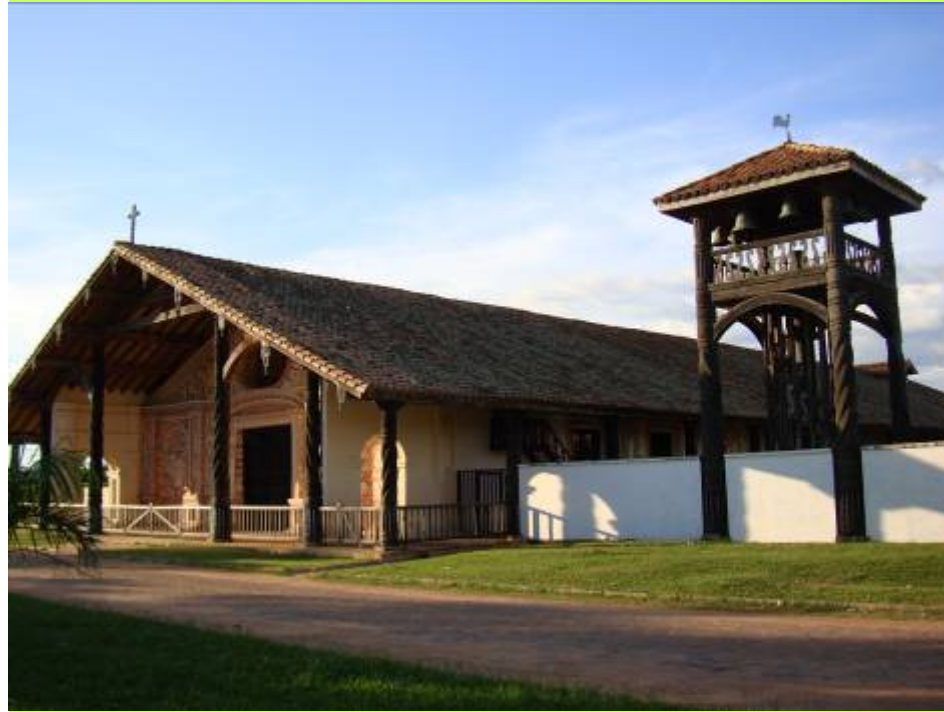
San Rafael de Velasco