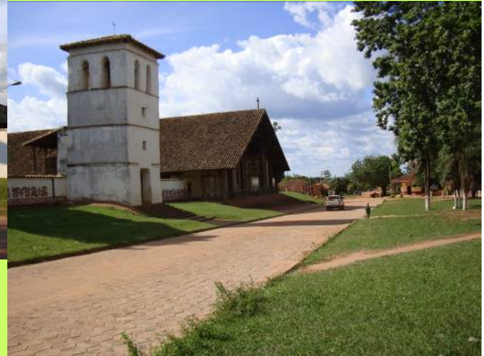
San Miguel de Velasco