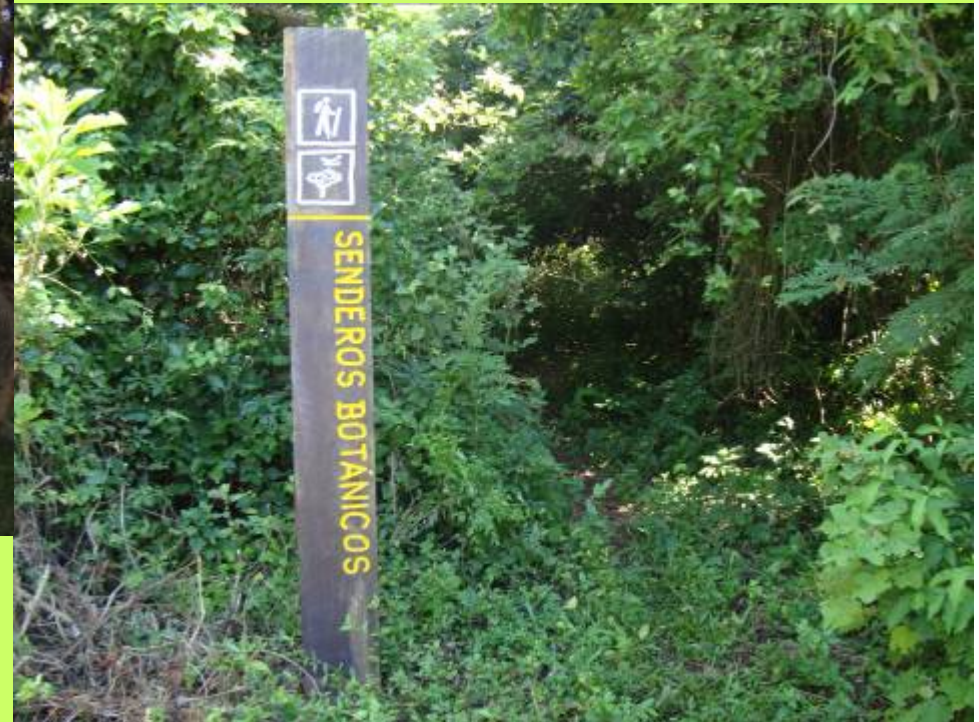
Senderos botánico en Santa Ana