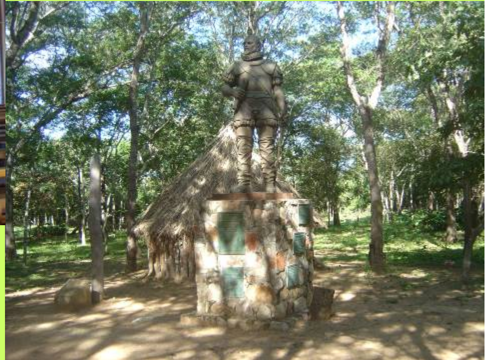
Santa Cruz la vieja