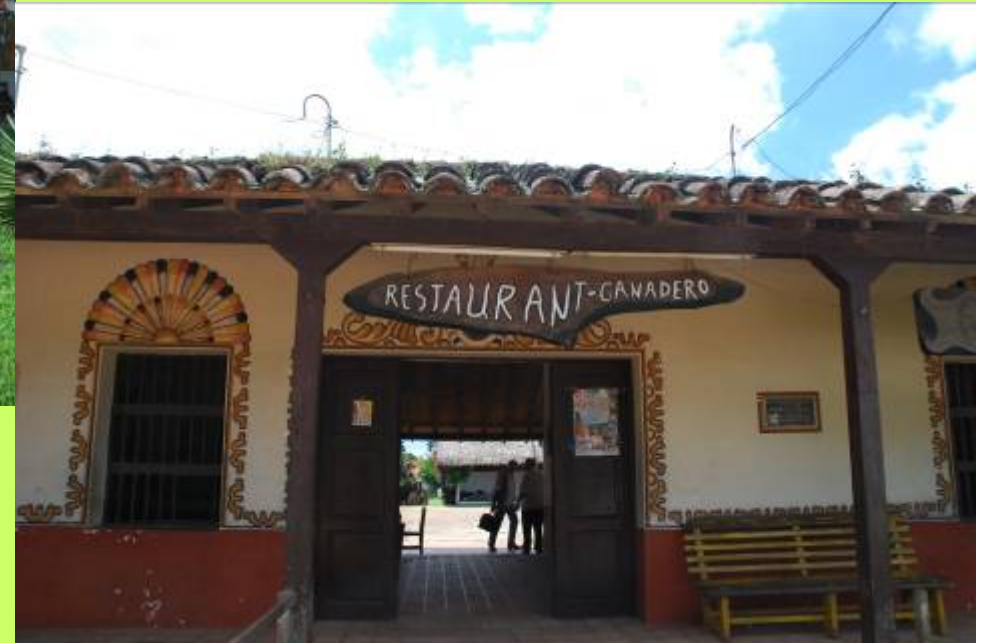
El restaurante tradicional “El Ganadero”