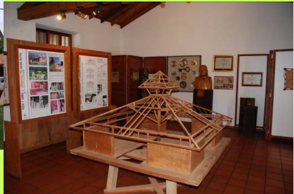
El museo misional