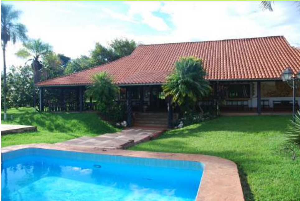
El comedor y la piscina