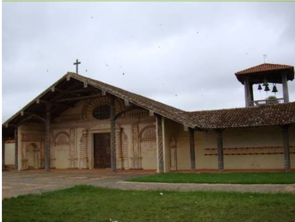
La Iglesia y su museo