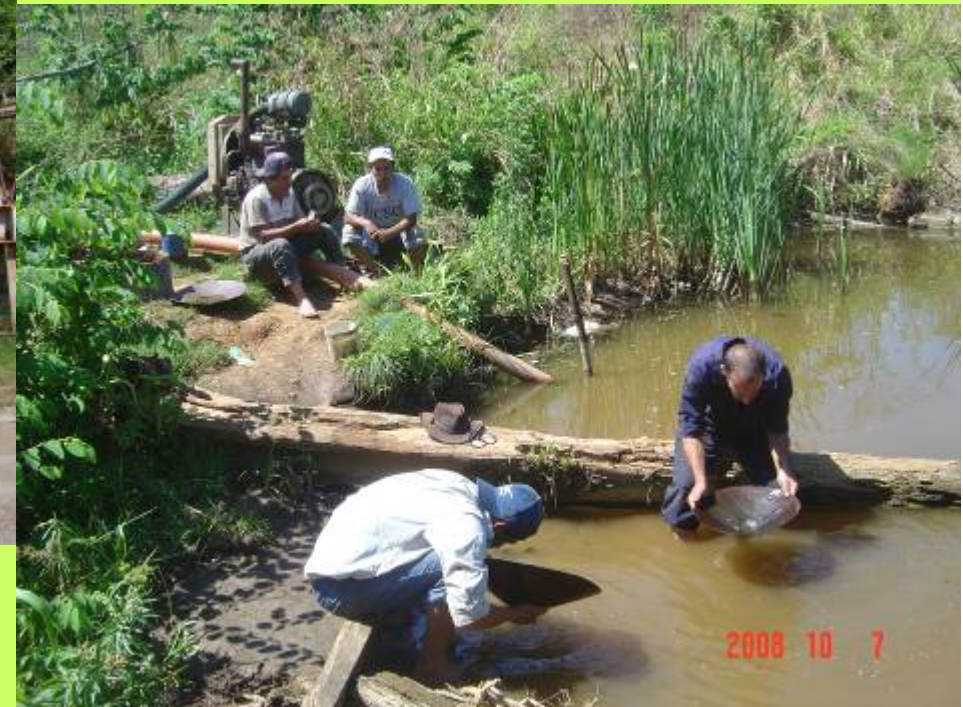
La búsqueda tradicional