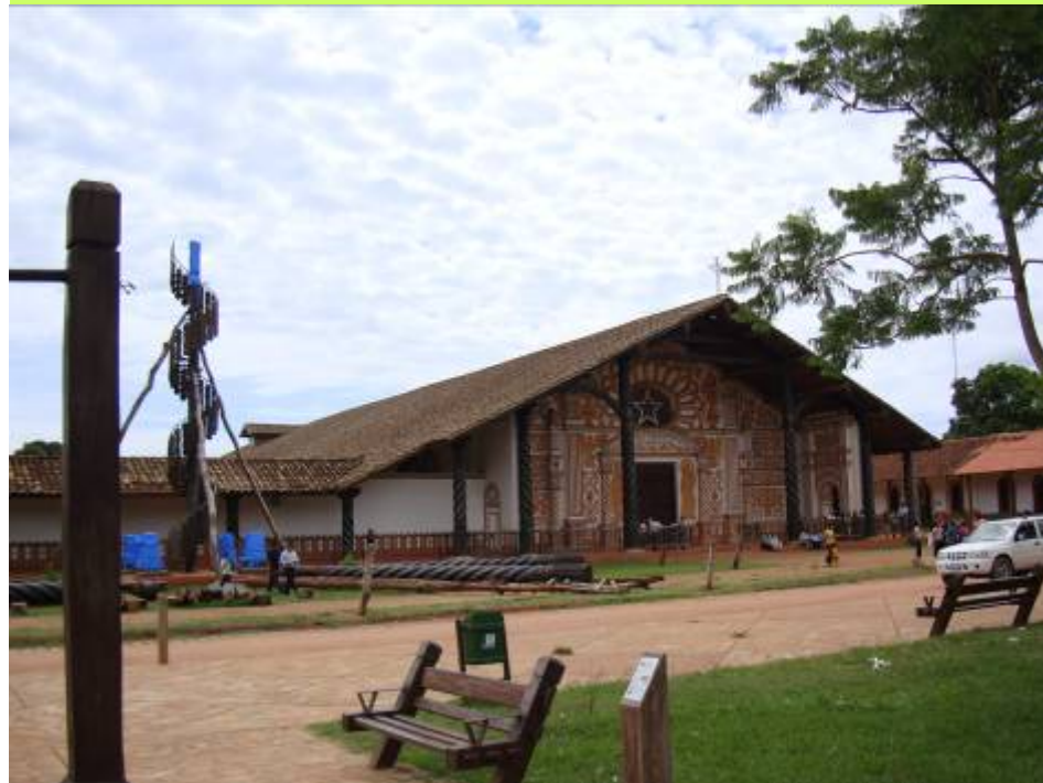
La Iglesia y su campanario en curso de rehabilitación