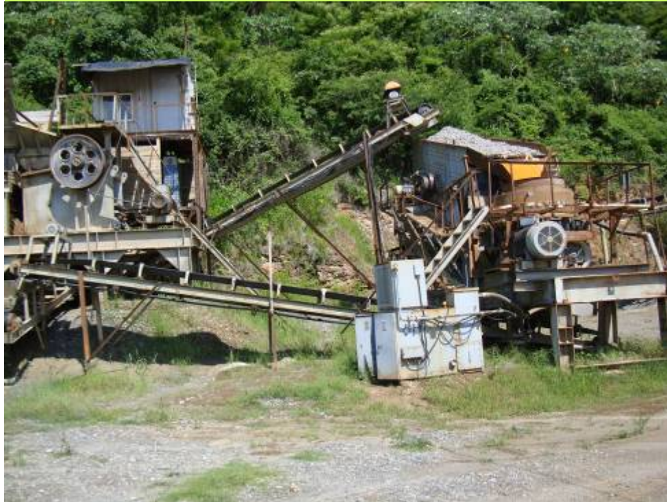
El proceso industrial