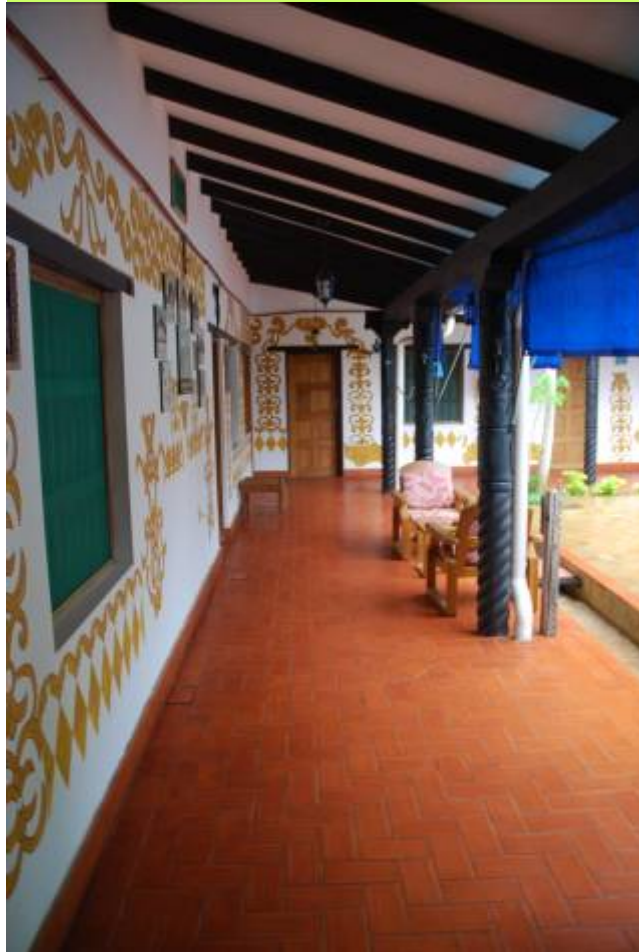
Diaporama de 13 diapositivas

André y Santa les acogen como en familia