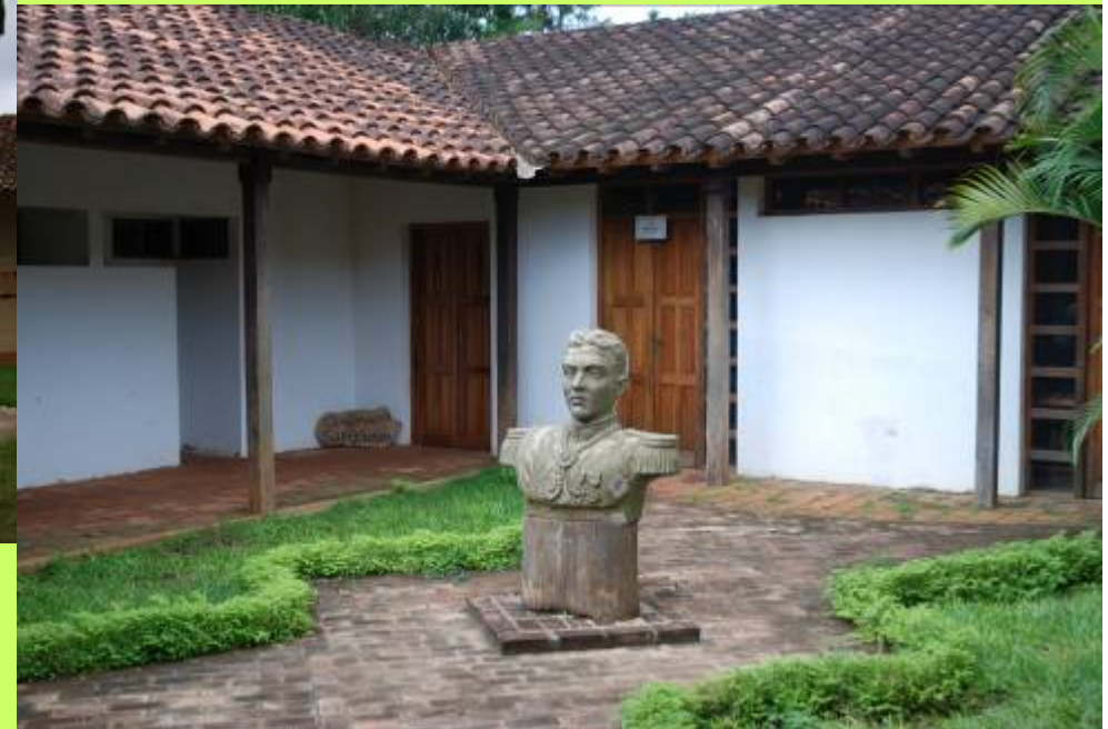
Museo costumbrista y casa German Bush